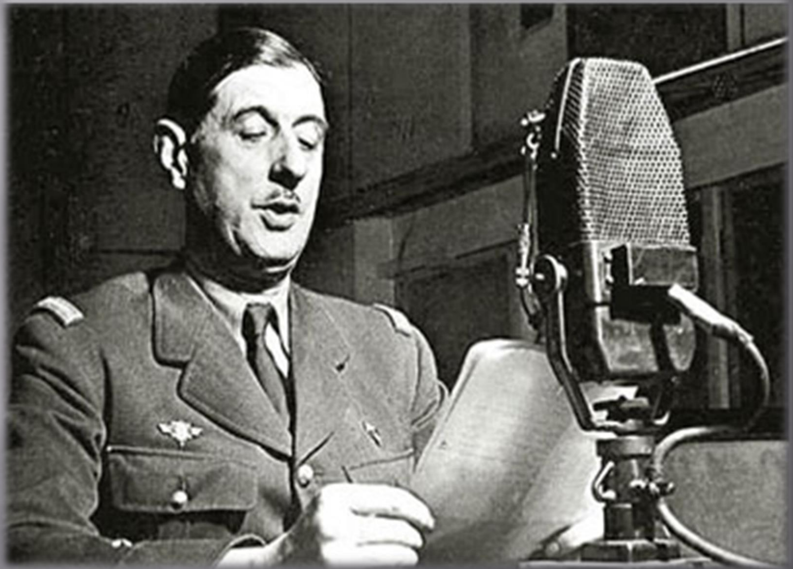
Le général Charles de Gaulle