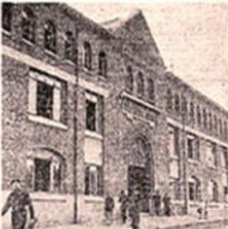
LA COMMANDE MILITAIRE ALLEMANDE A REIMS, LE 7 MAI 1945.